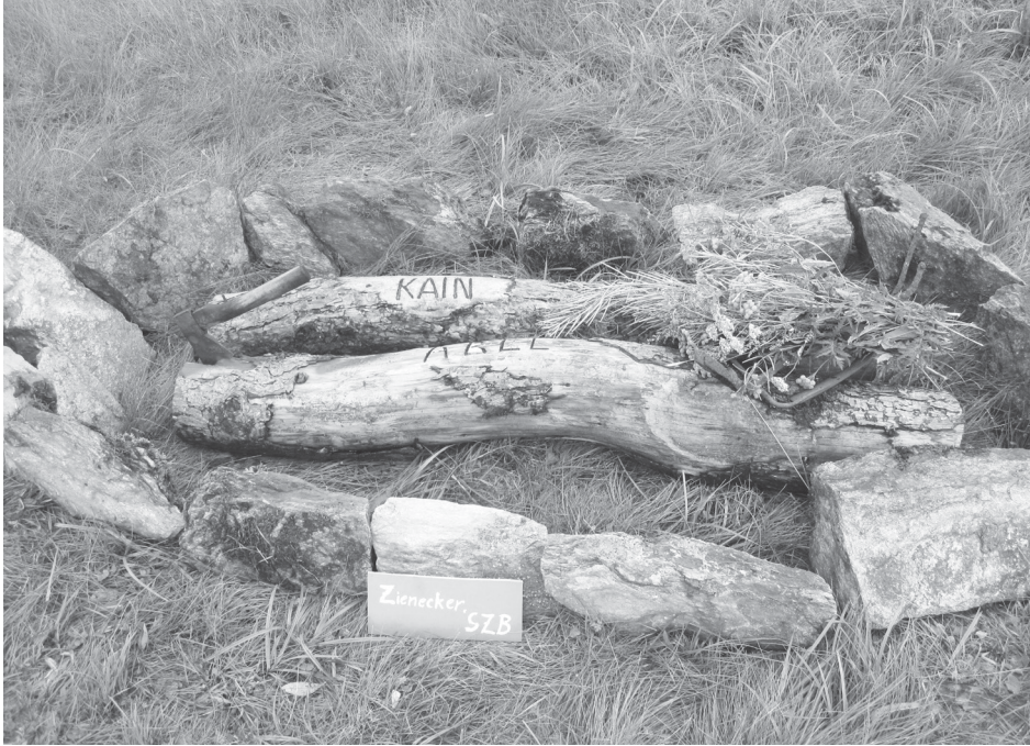
Abb. 3 Installation beim Land-and-Art-Festival Königsmühle 2012.

unter den Fragenden eine gewisse Anspannung zu spüren. Sie wich einer hörbaren Erleichterung als dieser diplomatisch ausführte, dass für ihn alle Parteien das Kainsmal trügen, da sie auf die ein oder andere Weise schuldig geworden seien.