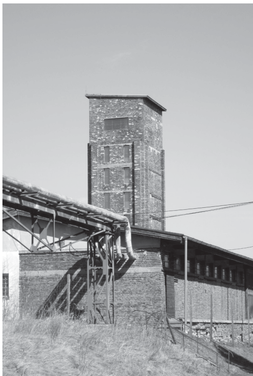
Abb. 2 „Roter Turm des Todes“ in Vykmanov/Tschiechien: Eine frühere Uranerzaufbereitungsanlage (1951–1956), die für die UNESCO-Nominierung ausgewählt wurde.

Der Vorschlag der tschechischen Welterbe-Projektgruppe, den Roten Turm des Todes (tsch. Rudá Věž Smrti), ein rotes Ziegelsteingebäude, in dem früher Uranerz geschrotet und gemahlen wurden, als Teil der MKEK zu nominieren, wird damit begründet, dass es sich „um den letzten erhaltenen Sachzeugen einer Uranerzaufbereitungsanlage im Erzgebirge“ (Website Welterbeverein Erzgebirge „Roter Turm des Todes“) handle. Zugleich soll es das „Leiden der politischen Häftlinge symbolisieren, die in den 1950er Jahren in den Joachimsthaler Zwangsarbeitslagern unter unmenschlichen Bedingungen inhaftiert wurden“ (ebd.). Die Anlage ist zwar im Besitz des Opfervereins, jedoch fehlen Gelder, um das Gebäude zu sanieren und als Museum der Öffentlichkeit dauerhaft zugänglich zu machen. Das Tschechische Fernsehen berichtete im Mai 2014 darüber, dass die Konföderation Absichten habe, das unter nationalem Denkmalschutz stehende Objekt an den Staat zu verschenken, da sie eine Summe von knapp 60 Millionen Kronen (ca. 2,2 Millionen Euro) für dessen Renovierung und Umbau nicht aufbringen könne (vgl. Tschechisches Fernsehen 2014). Durch den Status als Weltkulturerbe, so war die Hoffnung einer Vertreterin der