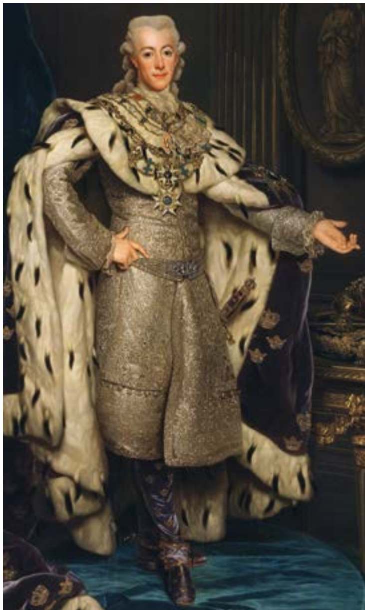
Bild 10. Alexander Roslin, Gustav III, 1746–1792, konung av Sverige .