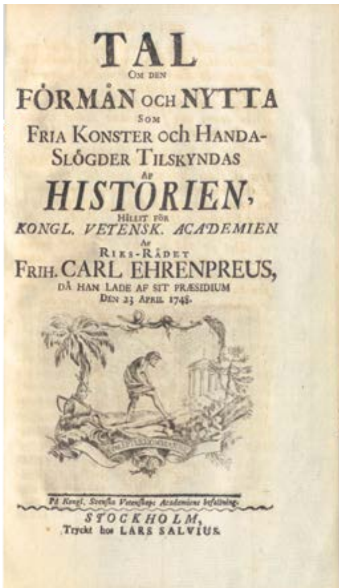
Bild 13. Titelsida till Carl Didrik Ehrenpreus Tal om den förmån och nytta som fria konster och handaslögder tilskyndas af historien (1748).