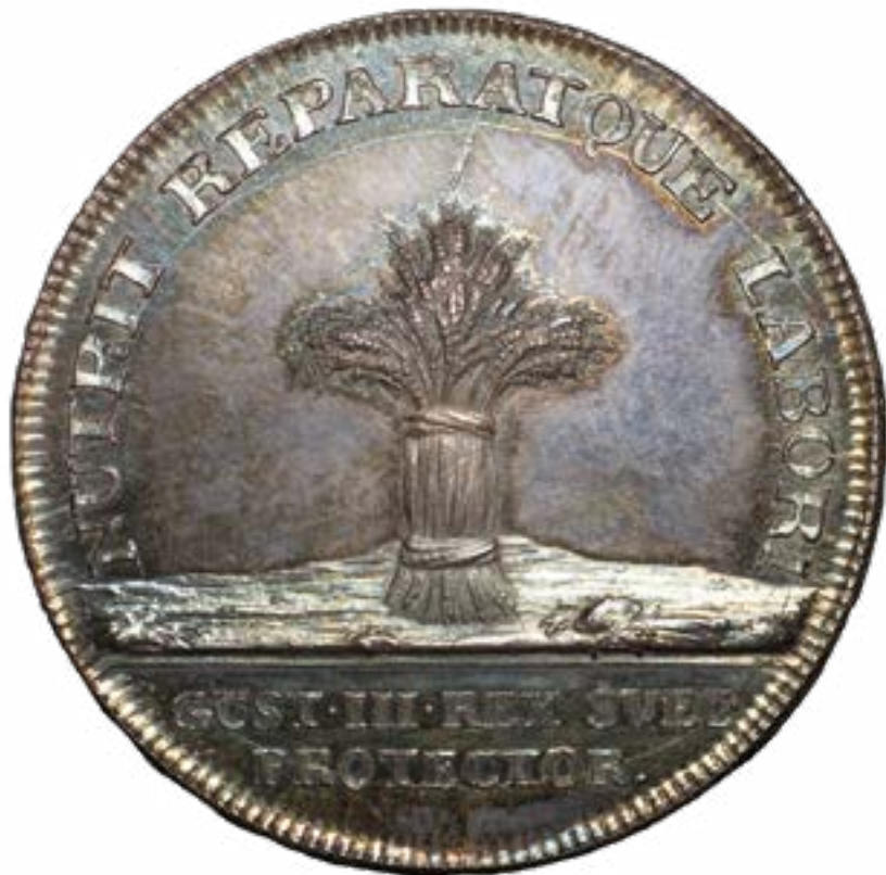
Bild 11. Gustaf Ljungberger, medalj slagen för att högtidlighålla att Gustav III blev Vetenskapsakademiens beskyddare 1771.

ringar i ett svar till Rudenschöld, där han tydligt sökte bekräfta bilden av sig själv som en vetenskapsfurste i Fredrik I:s och Adolf Fredriks efterföljd. Konungen beskrev akademien som en allmännyttig, framgångsrik och för fäderneslandet ärofull institution. Han betygade inte endast sin välvilja och sitt beskydd, utan klargjorde även att han avsåg att sätta sig in i dess arbete, tillägna sig kunskaper genom att närvara vid sammankomsterna samt uppmuntra vetenskaperna med sitt exempel. 658