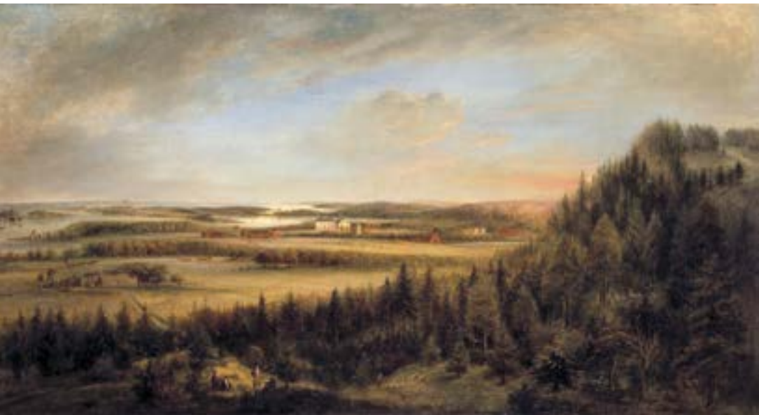
Bild 3. Elias Martin, Aspa Bruk . Samhälle och natur sågs som sammanlänkade inom ramarna för en gudomligt bestämd ordning.

jämviktsläge. Varken världen eller samhället var självreglerande i det tidigmoderna tänkandet. Liksom världens jämvikt ytterst garanterades av en vaksam och interventionistisk Gud som kunde korrigera de annars konstanta naturlagarna garanterades samhällets dito av aktsamma och justerande makthavare som kompletterade Skaparens verk. 102