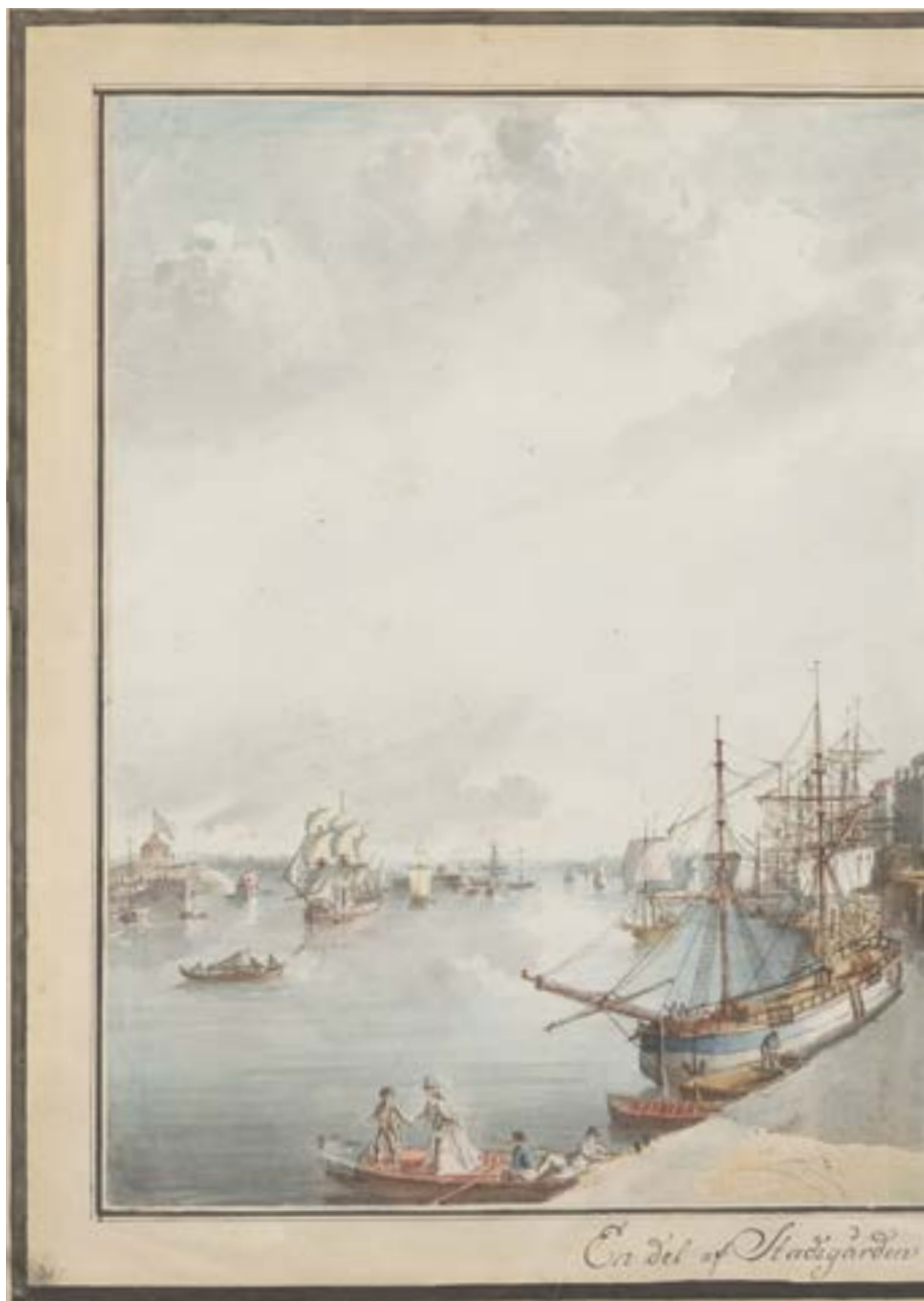
Bild 8. Martin Rudolf Heland, En del af Stadsgården kallad Barlastplacen . Foto: Uppsala och bejakade export av förädlade produkter.