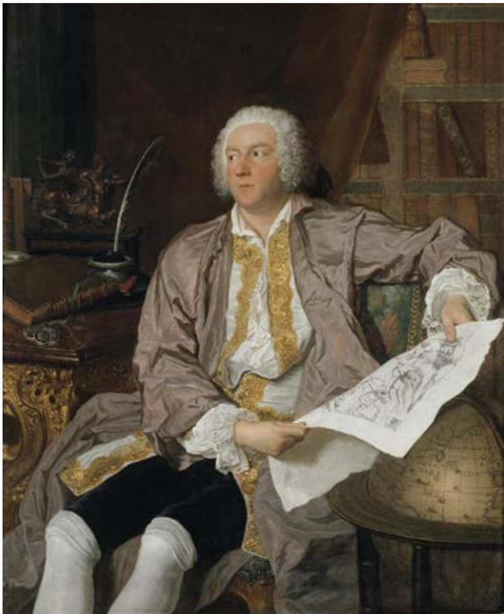
Bild 12. Joseph Aved, Greve Carl Gustaf Tessin (1695–1770) . Hattledaren Tessin var en av Vetenskapsakademiens högst uppsatta mecenater.