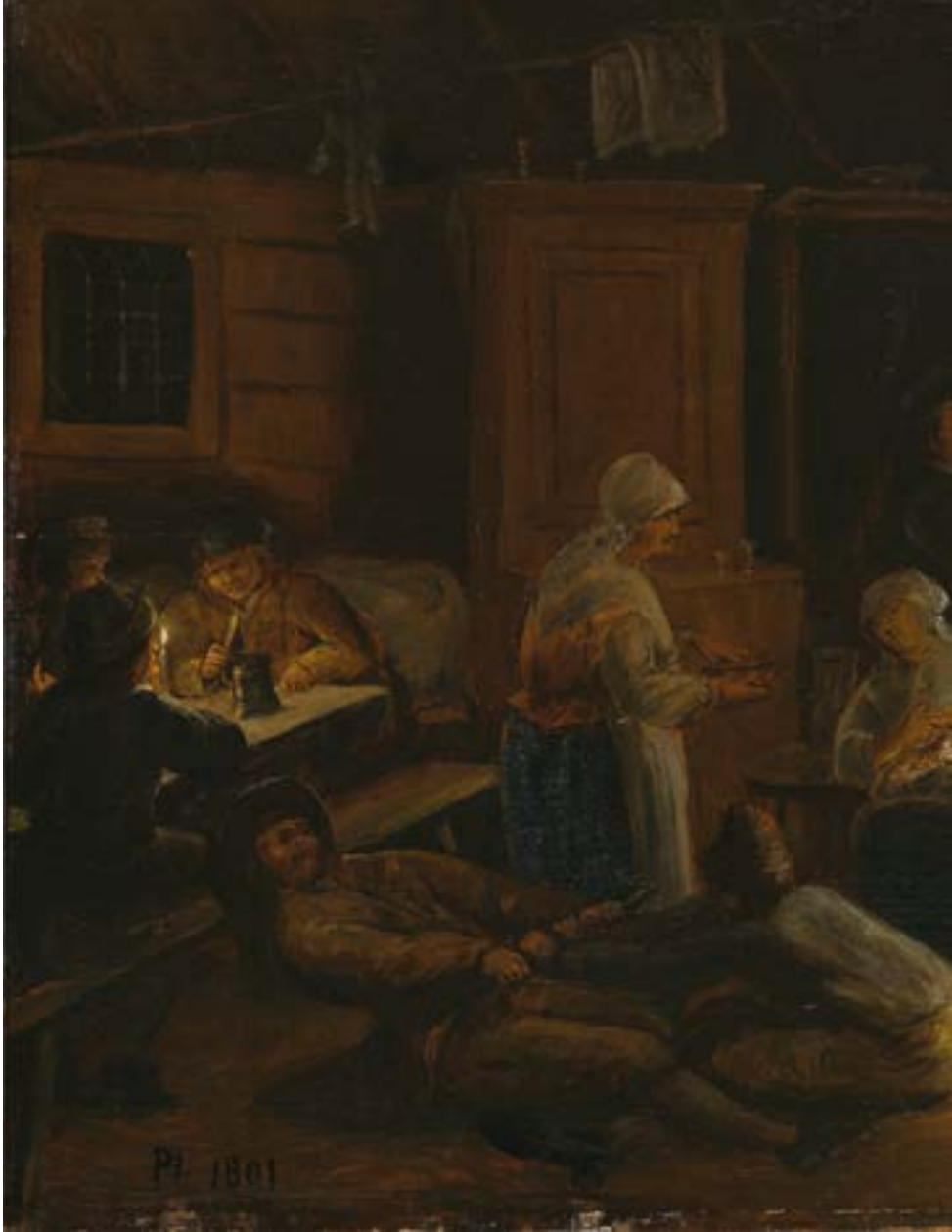
Bild 6. Pehr Hörberg, Interiör av en småländsk bondstuga . Ögonblicksbild