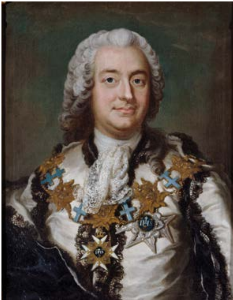
Bild 7. Carl Fredrich Brander, Anders Johan von Höpken, 1712–1789. Hattledaren och akademigrundaren Höpken.

sekreterare 1739–41, krönte en lång bana i partiets tjänst med att bekläda riksråds- och kanslipresidentämbetena. 344 Alströmer utnämndes till kommerseråd och bedrev näringsverksamhet som subventionerades av hattregimen. Triewald utgjorde den förmedlande länken mellan hat-