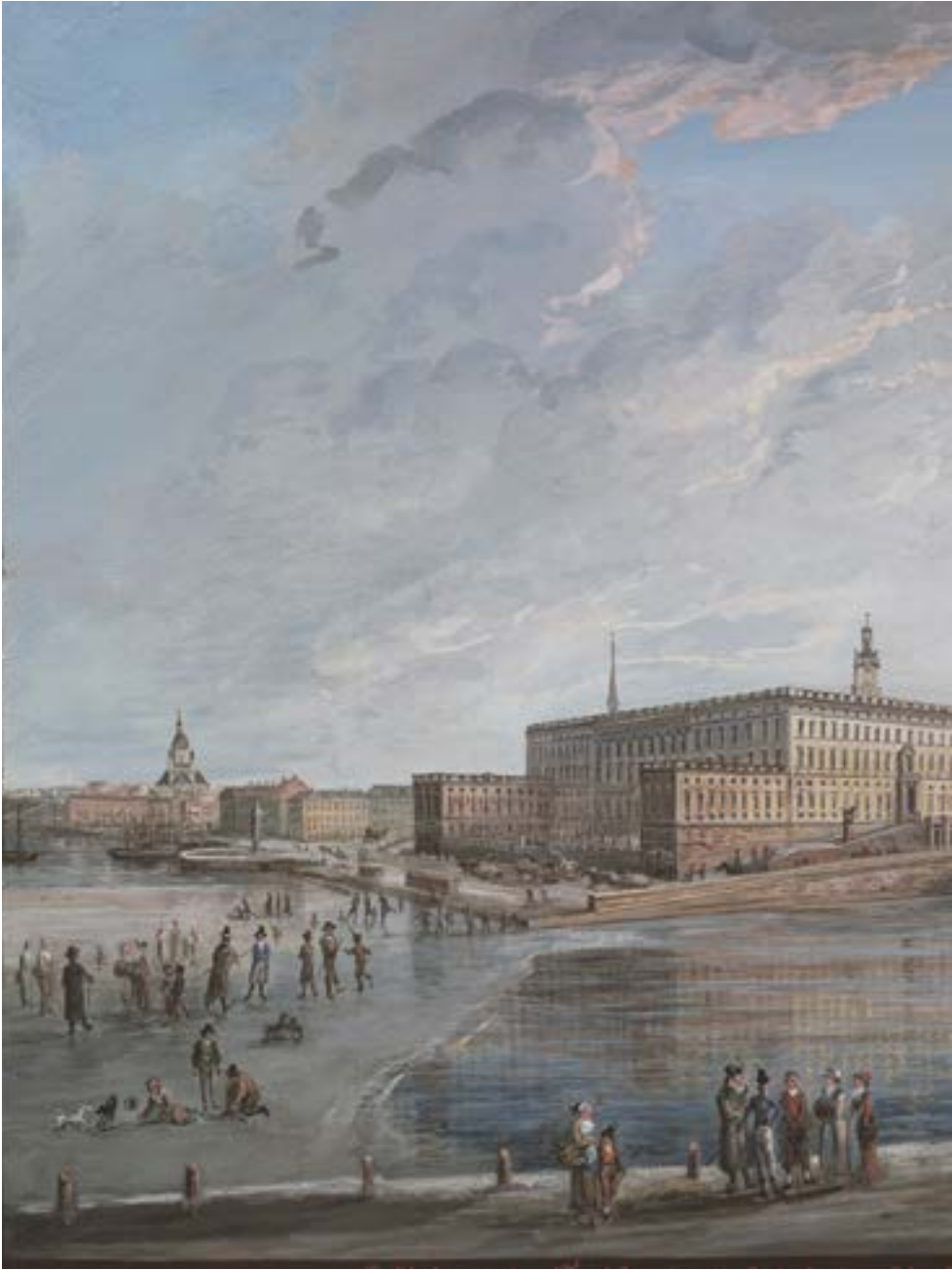
Bild 1. Elias Martin, Stockholmsvy. Utsikt från Fersenska terrassen . Foto: Nationalmuseum. Kungliga