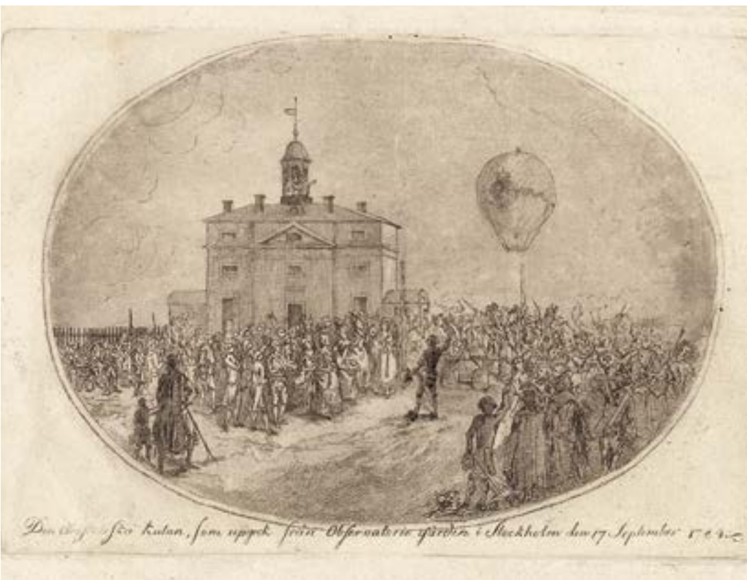
Bild 2. Den Aerostatica Kulan, som uppgick från Observatoriegården i Stockholm den 17. September 1784. Vetenskapsakademiens utforskande av skapelsen, här i form av en ballonguppsändning, innebar att den förknippades med karisma.

samtid åsiktsmässigt homogen. 67 Den utgjorde särskilt under frihetstiden ett forum för diverse myndighets-, grupp- och företagsintressen och kan därmed betraktas som en paraplyorganisation eller ”trading zone”, en plats där olika ”subkulturer” möts. 68 Föreliggande analys söker följaktligen belysa ideologiska ledmotiv inom akademien, inte belägga den med allmängiltiga, programmatiska ståndpunkter.