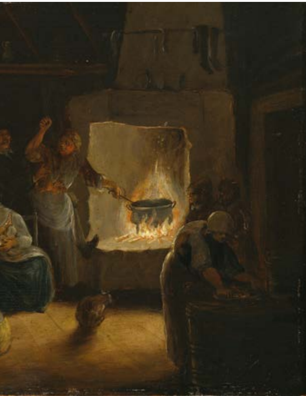
från en lägreståndsmiljö.