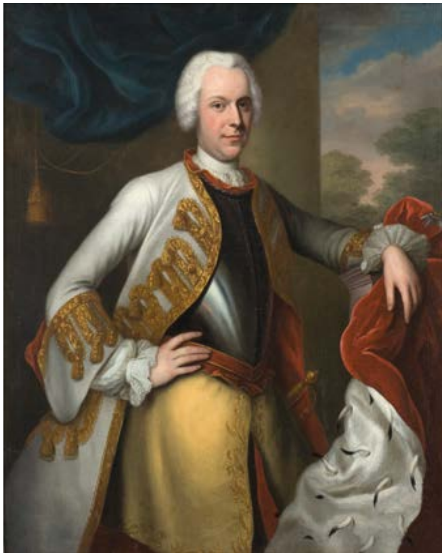
Bild 9. Balthasar Denner, Konung Adolf Fredrik .