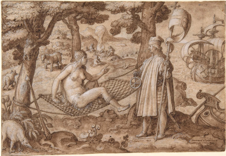
Abbildung 1: Jan van der Straet: »Allegory of America«, ca. 1587-89.

Die geschlechtliche wie positionelle Differenzierung der alten und neuen Welt zeigt nicht nur den im kolonialen Bestreben inhärenten Eros, sondern auch, wie zentral das Motiv der Stagnation und des Stillstandes in diesem Kontext ist, die in der Untätigkeit der Frau (ebenso wie beispielsweise in der Abbildung des in Amerika heimischen Faultiers) Ausdruck finden. »Land is named as female as a passive counterpart to the massive thrust of male technology«, so lautet die akkurate Beschreibung dieser Dynamik durch