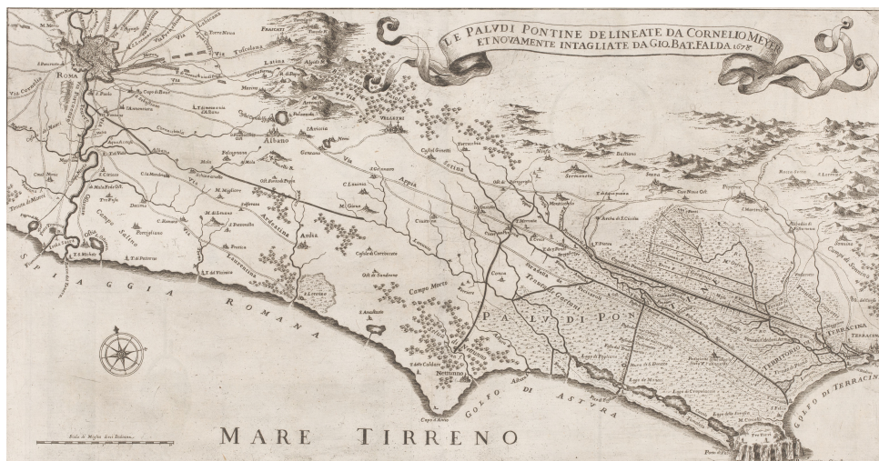
Fig. 2: Palude Pontine, incisione di Giovanni Battista Falda su disegno di Cornelio Meyer, 1678.

L'Italia del nord rimase successivamente fino al termine della guerra nelle mani degli austriaci, situazione che consentì a Livio di sentirsi al sicuro e veder svanire gli intenti di confisca dei suoi beni.