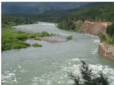
El río Bío Bío fue la frontera entre la zona Mapuche y la corona española durante tres siglos.