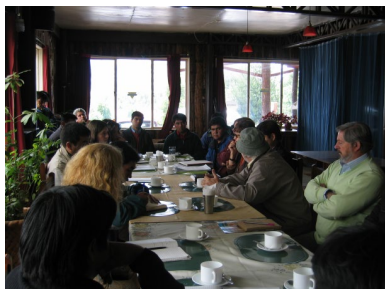
Una conferencia en Ralco, Alto Bío Bío 2005, con líderes y lideresas de la región.

Desde el levantamiento de 1881, que los Mapuche perdieron con los chilenos, han sido colonizados y hoy muchos Mapuche pertenecen a los grupos de población más pobre y marginada de Chile. Hasta esta fecha los Mapuche eran independientes desde 1598 del imperio español. No estaban dominados y estaban bajo sus