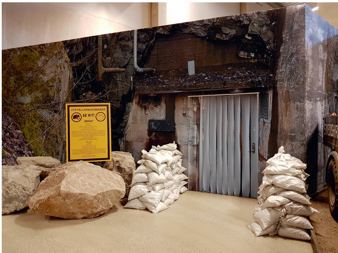
Bunkerinstallation på Arsenalen, Strängnäs. Den nybyggda bunkern ska ge intryck av att vara gjord av skyddande betong.

och det metaforiska urberget, en särskild signifikans i kalla krigets kultur och länkas samman med ett slags nationell urhistoria och djupidentitet. Utsagan att i ”graniten i berget fanns det som skulle göra landet oknäckbart” från tv-dokumentären Skymningsläge – Sverige under kalla kriget (2016) är ett exempel på att låta berget stå som garant för den svenska tryggheten. I den uppbyggda kalla kriget-bunkern på Arsenalen sammanfaller betongen och berget under rubriken ”Underjorden”: