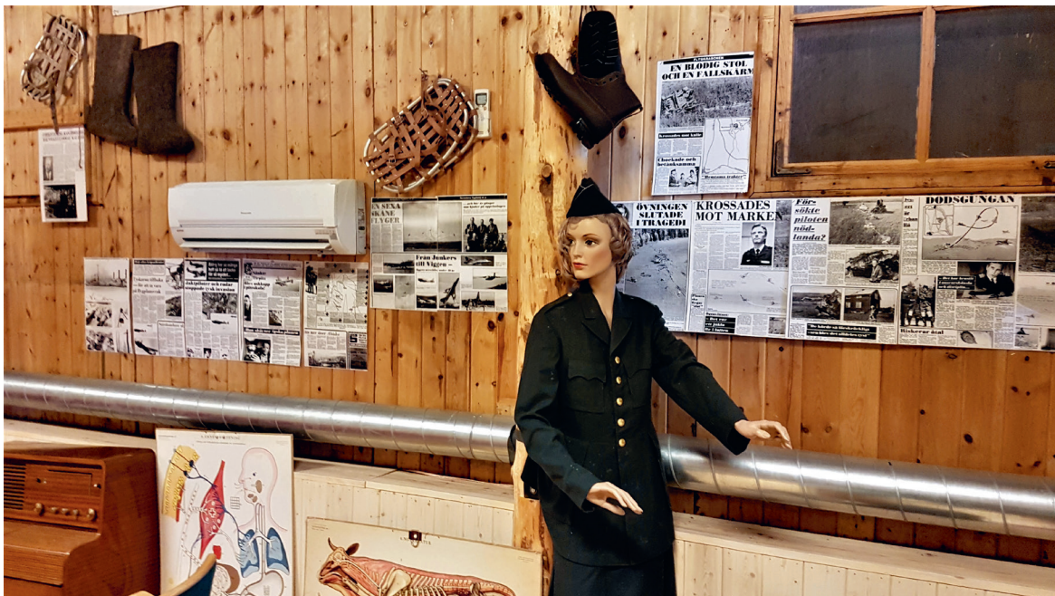
Interiör från soldatbiografen med ansamling av till synes disparata föremål, Kalixlinjens museum, Viltfarmen.

fick veta att det påbörjats ett registreringsarbete på Aerozeum. Objektet hade här inte en entydigt definierad status, de stod ibland utomhus i väntan på att eventuellt inrangeras i samlingen eller att användas till något annat. Gränsen mellan rekvisita och samlingsföremål var upplöst, vilket öppnade för att föremål utan adekvat proveniens kunde göras om och ställas ut som om de vore autentiska utställningsobjekt.