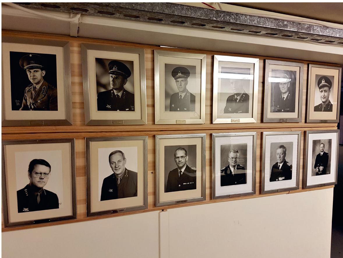
En nationell, militär och manlig genealogi visualiserad på Gotlands Försvarsmuseum.

När den säkerhetspolitiska urtiden gestaltas genom en förment tidlös urnatur läggs den fast som överskridande och allomfattande.