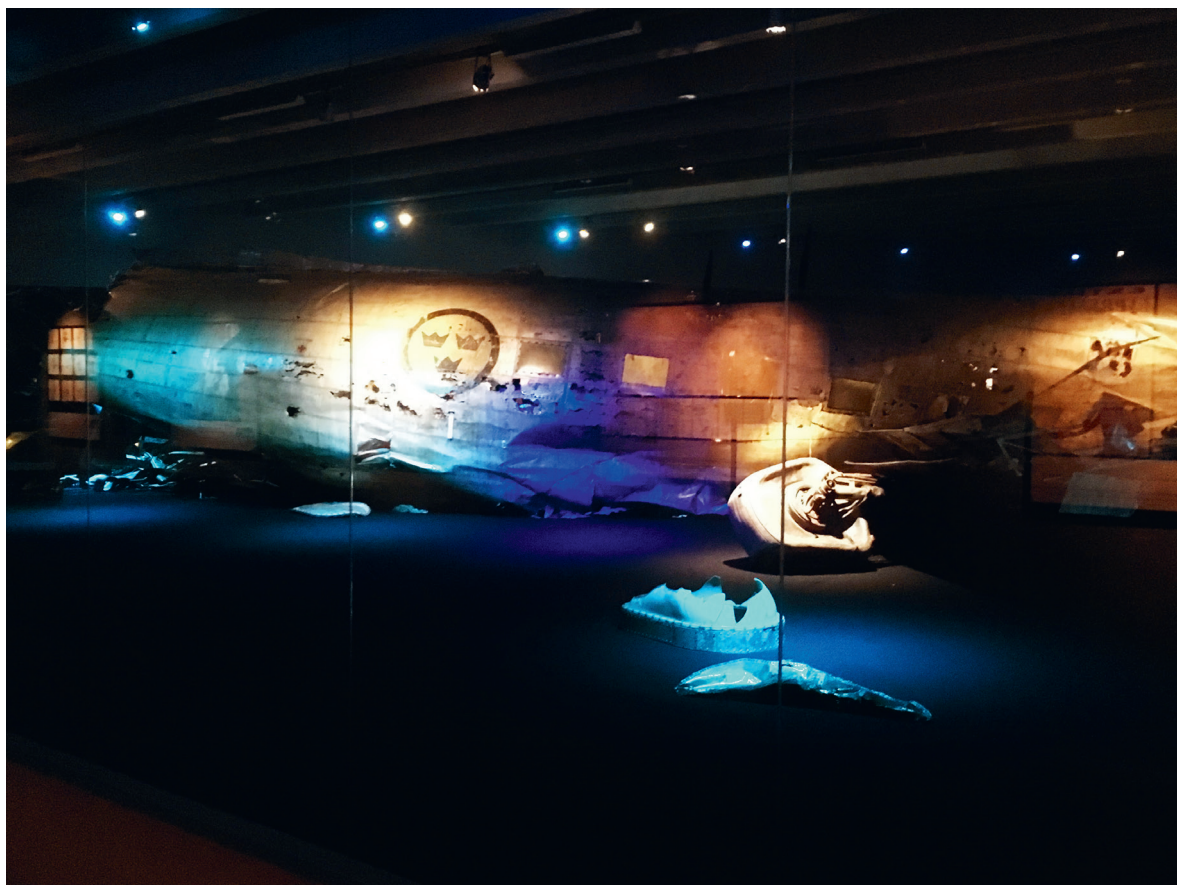
Installationen med vraket av den nedskjutna DC3:an på Flygvapenmuseum.

har gjort det, för en museipedagog hade inte tillåtits vara så tillätande som jag är. Grejerna hade varit avspärrade, det hade varit inhägnat, det hade varit stängda monstrar” (intervju 22/3 2019). På museet undvek de anställda att överhuvudtaget prata om sina utställda objekt som museiföremål, oavsett om de var del av samlingen eller fungerade som rekvisita: ”Så att därför undviker vi museiföremål, utan det får Flygvapenmuseum som har ansvaret och har pengarna och uppgiften [ta hand om]” (intervju 22/3 2019). Till skillnad från formell kulturarvifiering, där tingens aura inskräps genom fokus på proveniens, ordnande och distan-