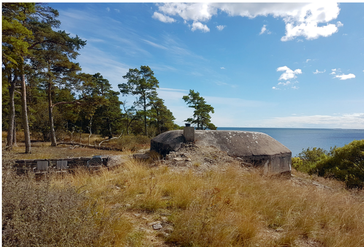
En uteplats med bunker och utsikt mot horisonten på Bungenäs.

kare erbjuds att mer direkt förkroppsliga en svensk kalla kriget-soldat eller inta en nationell beskyddarposition. Inom kulturarvsramen möjliggör detta både lustfylld lek, till exempel att åka olika militärfordon, och estetisk njutning, som när kalla krigets eldlinjer ut mot Östersjön omvandlas till strålande havsutsikter i exploateringen av Bungenäs.