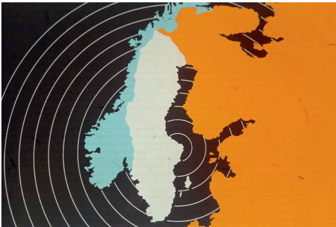
Ett utsatt och vitt territorium. Kartbild från Totalt krig-installation på Flygvapenmuseum.

av ett helt vitt Sverige. Den hotande geografi som omgav det svenska territoriet åskådliggörs än starkare på en av museets kartor där även det neutrala Finland fått röd färg och alltså skildras som del av östblocket. Denna karta visar tydligt hur kartor både formas av och formar övertygelser och försanthållanden, i detta fall att Sverige var ensamt och geografiskt starkt utsatt mellan öst och väst. När Sverige konsekvent gestaltas med hjälp av den vita färgen – traditionellt associerad med oskyldighet och oskuld – kan landets befolkning komma att förstås som symboliskt och kroppsligen vit och skuldlös, utan att denna chauvinistiska och i grunden rasistiska föreställning medvetet kommuniceras.