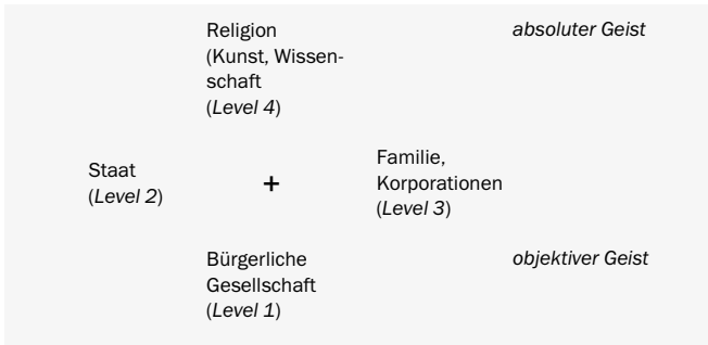
Abbildung 6 Das Gesellschaftssystem nach Hegel