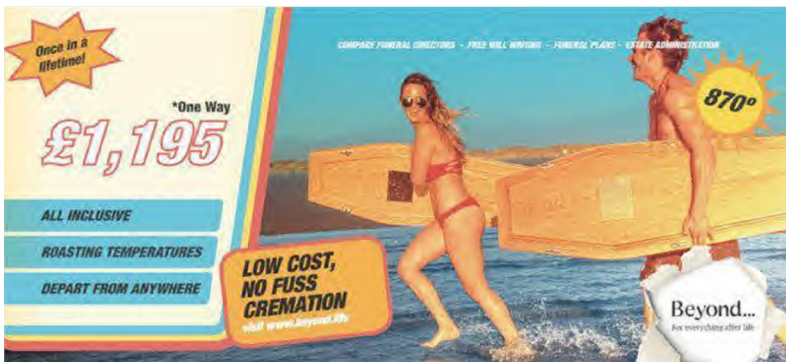
Imagen. «El macabro anuncio de una funeraria que ofrece un viaje con todo incluido al más allá», El Mundo , 7 de agosto, 2018. https://www.elmundo.es/viajes/europa/2018/08/07/5b6990d5e5fdea3b6d8b4641.html .

Respecto de los disfemismos, la ausencia de todo componente religioso implica que el tratamiento de la muerte parezca irrespetuoso: la muerte, en su visión laica, es un viaje vital de no retorno, ya se aluda al comienzo del viaje ( pedir pista ; ahuecar el ala ; pirarse ) o al destino final ( irse al otro barrio ; irse a criar malvas ). Este sentido laico-humorístico se lleva al extremo en un anuncio de la empresa funeraria británica Beyond («más allá»), que publicita un paquete todo incluido «desde cualquier parte», con «temperaturas abrasadoras», solo con «billete de ida»: