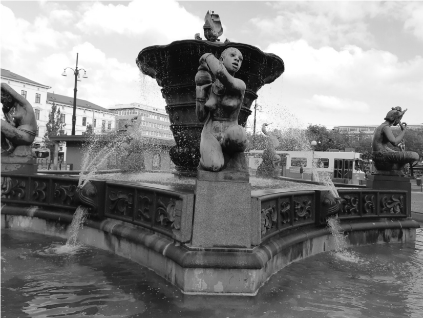
Järntorgsbrunnen (även kallad De fem världsdelarna ).