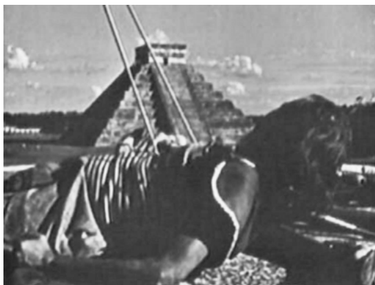
Abbildung 3: Chilam Balam s letzter Blick auf Kukulcán

Quelle: Chilam Balam (MEX 1955, R: Iñigo de Martino)