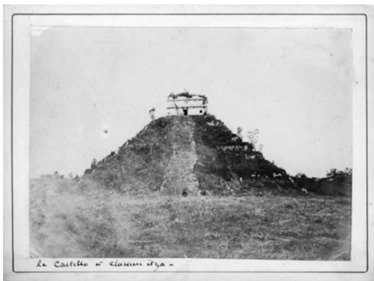
Le Castillo á Chichén Itzá (por Désiré Charnay). Inv. 417699. Sinafo-Inah.

Abbildung 1: Der verlassene, in sich ruhende Tempel von Kukulcán in seinem natürlichen Zustand des »accident ralenti« (Jean Cocteau), eines Unfalls in Zeitlupe vor der Rekonstruktion, aufgenommen im Jahr 1860 von dem französischen Archäologen und Neue-Welt-Enthusiasten Désiré Charnay.