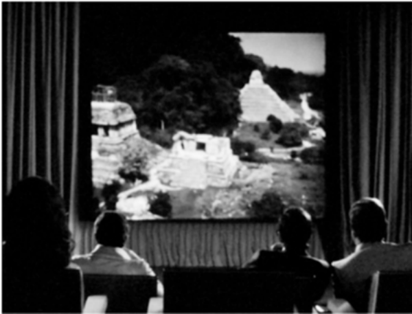
Abbildung 6: Die Ruinen in der Höhle der Zensoren