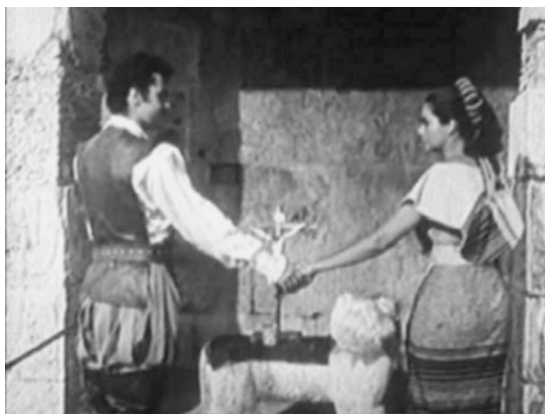
Abbildung 4: Hybrider Ehebund vor einem hybriden Altar

Quelle: Chilam Balam (MEX 1955, R: Iñigo de Martino)