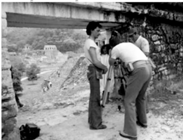
Abbildung 5: Entstehung eines documental oficialista

Quelle: Cascabel (MEX 1977, R: Raúl Araiza)