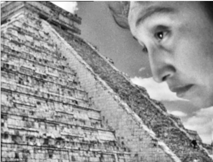
Abbildung 2: Que viva Mexico! – Der Mensch in ikonischer Symbiose mit den Relikten seiner télé-histoire.