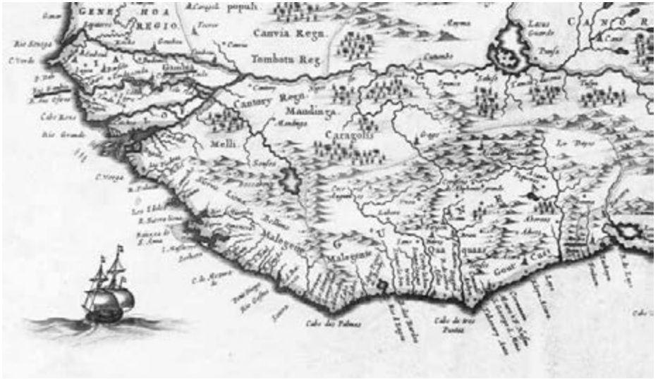
Uitsnede uit: Nigritarum Regnum , Amsterdam, Erven van J. Janssonius ca. 1664. Linksboven: (Rio) Gambia en rechtsonder: Ardra

Evenmin beschikte zij over voldoende middelen om de slavenhandel door smokkelschepen ('lorrendraaiers') afdoende te bestrijden. 1 Sinds 1655 gaf de WIC daarom tegen betaling van een recognitie (belasting) concessies aan particuliere reders voor private slavenhandel op West-Afrika. 2 Jaarlijks werden door handelaren uit de Republiek 3000 slaafgemaakten ingekocht in Ardra (ook: Ardera, Ardre, Arder, Harder, afb.1, rechtsonder) aan de Slavenkust (Togo, Benin en delen van Nigeria). 3 De Groningse WIC-kamer maakte bovendien private slavenvaart mogelijk door haar handelsrechten op Gambia (afb.1, linksboven) te verkopen. 4