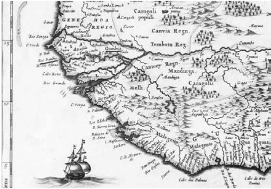
Uitsnede uit: Nigritarum Regnum , Amsterdam, Erven van J. Janssonius ca. 1664. Herskovits Library of African Studies, Northwestern University Libraries. Onderstreept: (Rio) Gambia