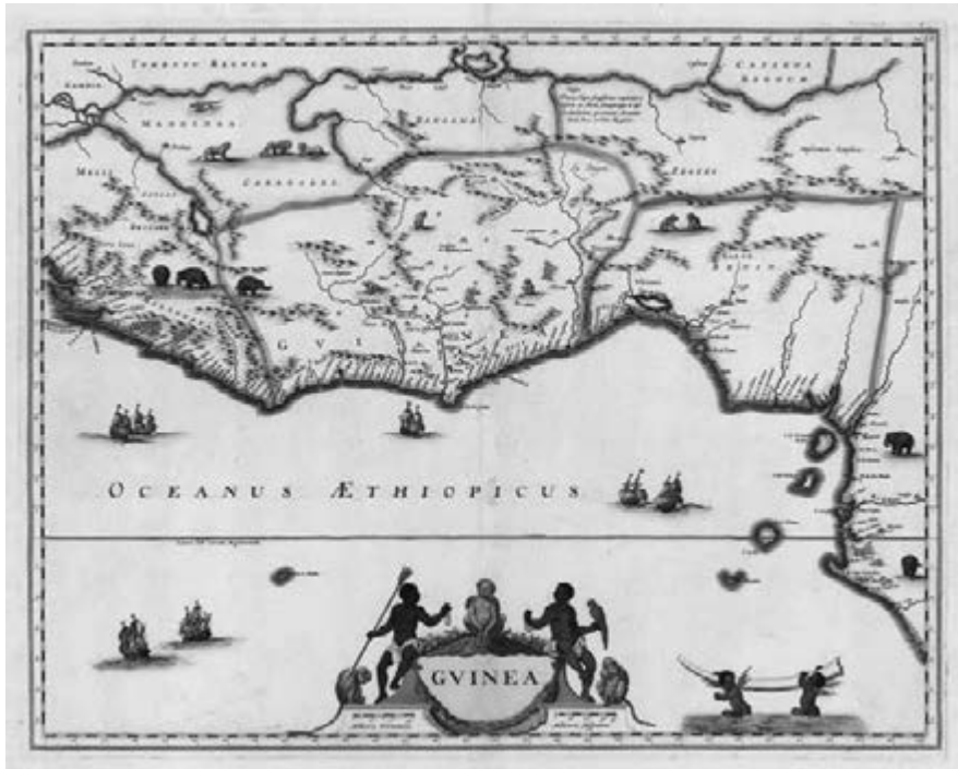
Joan Blaeu (1630-1673), Guinea, Amsterdam, 1662.