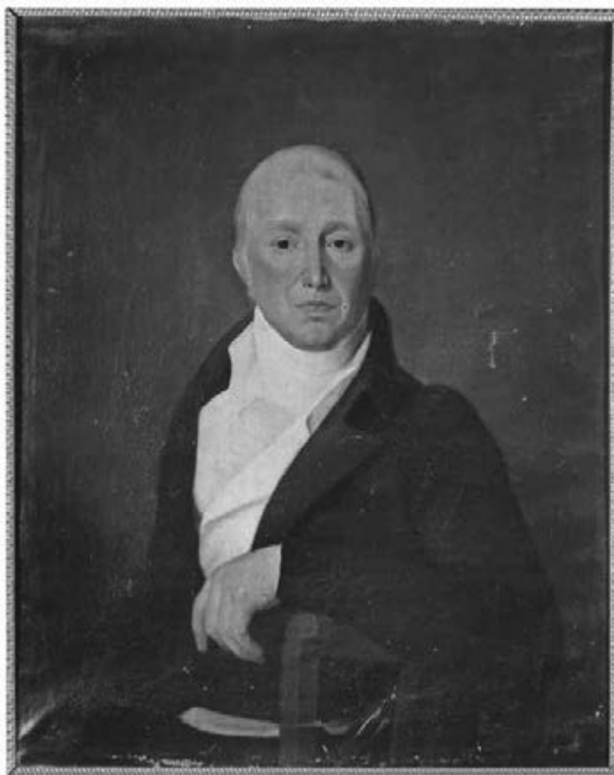
Wybo Fijnje; olieverf van/naar mogelijk Taco Scheltema (ca. 1800)

WYBO FIJNJE (1750-1809), een Haarlemse predikantenzoon, woonachtig te Leiden, begon na zijn opleiding aan het Seminarium kortstondig zijn carrière als leraar in Deventer (1774), maar verkaste spoedig naar Delft waar hij vanaf 1775 uitgever/journalist van de Hollandsche Historische Courant werd. Datzelfde jaar trouwde hij met de niet onbemiddelde dochter van de Leidse uitgever van de Gazette de Leyde , Emilie Luzac, lidmaat van de Waalse kerk. In Delft steeg Fijnje als intellectueel en genootschapsman snel op de sociaal-culturele ladder. Politiek manifesteerde hij zich vanaf 1785 als prominent patriot steeds meer in de voorste rijen. Zijn aanvankelijk lokale krant werd, mede dankzij zijn belangrijke medewerker en propagandist Gerrit Paape, steeds meer een nationale spreekbuis van het revolutionaire activisme. In 1783 was Fijnje betrokken bij de oprichting van het Delftse exercitiegenootschap; in oktober 1785 zou hij, samen met onder anderen Pieter Vreede, François van der Kemp