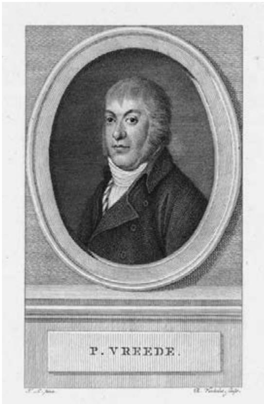
Pieter Vreede; gravure door Reinier Vinkeles I, naar T.L. (ca. 1800) (RP-P-OB-62.976)

gemankeerde geest, die al vroeg zijn poëtische en polemische pen in gedichten en pamfletten omzette, vaak onder het pseudoniem 'E.H.J' (Een Hollands Ingezetene), 'Frank de Vrij' en 'Hermodius Friso'. Veel van zijn geschriften richtten zich bij herhaling tegen het verval van politiek en economie, tegen het abjecte stadhoudelijke staatsbestel en de aristocratie, waartegenover hij als alternatief de patriottische revolutie preekte. Na de Pruisische interventie van 1787 vluchtte hij eerst naar Antwerpen en vestigde zich later in Tilburg – in Staats-Brabant hielden zich veel patriotten schuil. Vreede ontwikkelde zich ook hier in het zuiden tot een centrale figuur in het patriottisme en werd een belangrijke emancipator van Brabant. Toen in september 1794 de Franse troepen in Tilburg arriveerden, nam generaal Pichegru zelfs intrek in Vreedes huis dat tijdelijk als hoofdkwartier fungeerde. In 1796 werd Vreede namens de kieskring Bergen op Zoom lid van de eerste Nationale Vergadering. Hij ontpopte zich als een groot voorstander van de republikeinse, gecentraliseerde staatsvorm.