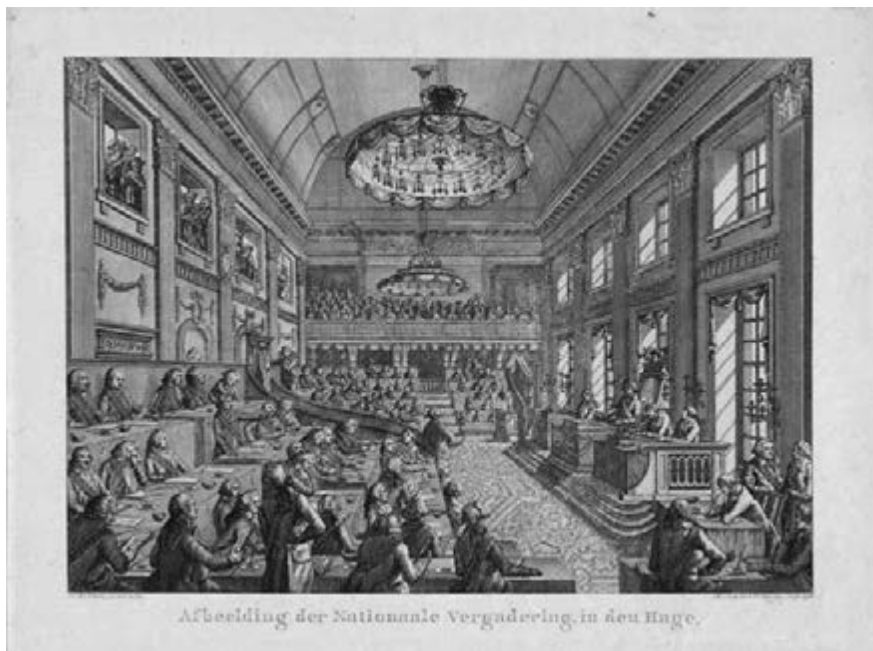
Nationale Vergadering te Den Haag; gravure door Reinier Vinkeles I naar Jan Bulthuis (1796) (RP-P-OB-64.106)

In zijn replek op het commissieverslag, een indrukwekkende rede van zo'n drie kwartier, laat Vreede geen spaan heel van het rapport-Floh, dat hij als een 'kunstig schandstuk' neersabelt. Onder de inmiddels uitdijende rij van bestrijdingen van de slavernijschande uit doperse koker, is haars gelijke niet aangetroffen: niet wat de kracht van argument aangaat, evenmin qua retorisch raffinement, noch wat de doorleefde hartstochtelijkheid betreft. Hierom is deze toespraak, een verbaal monument, gericht tot het parlement en dus tot de gehele Bataafse burgerij van Nederland, 70 als bijlage toegevoegd, zodat de behandeling hier beperkt kan zijn.