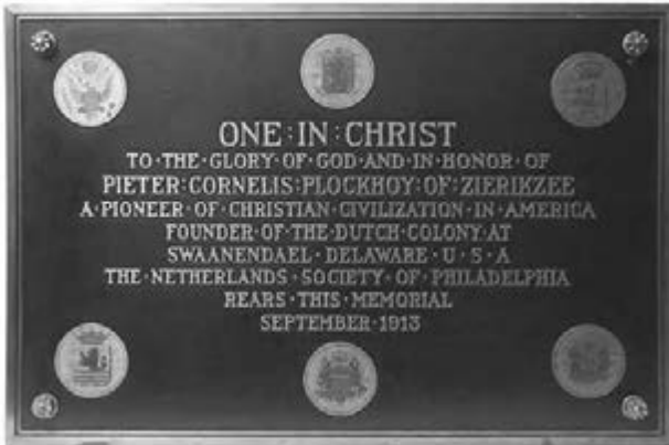
Bronzen plaquette ter herdenking van de stichting van een slaven-vrije kolonie nabij Swanendael (Delaware, VS) door Pieter Cornelis Plockhoy in 1663 (Netherlands Society of Philadelphia, 1913)

Het zou tot 28 juli 1663 duren dat Plockhoy eindelijk met een gezelschap van 40 kolonisten bij Hoerenkil en Swanendael (nabij het huidige Lewes, Delaware) van boord van het zeilschip de St. Jacob zou gaan om het bijzondere samenlevingsexperiment zonder slavernij te beginnen. De tragiek der geschiedenis wil echter dat deze utopische gemeenschap nooit uit de opstartfase van de bouw van blokhutten en landontginning zou geraken, omdat de krijgslustige Engelsen van koning Karel II onder leiding van kolonel Robert Carr eind augustus 1664 de Nederlandse en Amsterdamse bezittingen, met inbegrip van Plockhoy's voorgebakken hemel op aarde, onder de voet liepen en zich toe-eigenden. 11