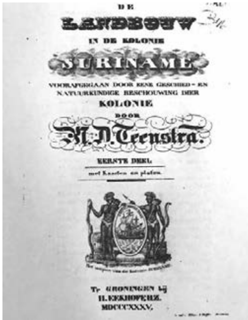
Teenstra, De Landbouw In De Kolonie Suriname (1835), deel I

terwijl hij eerder pogingen had gedaan om zelf twee tijdschriften te lanceren, die echter geen lang leven waren beschoren. 37