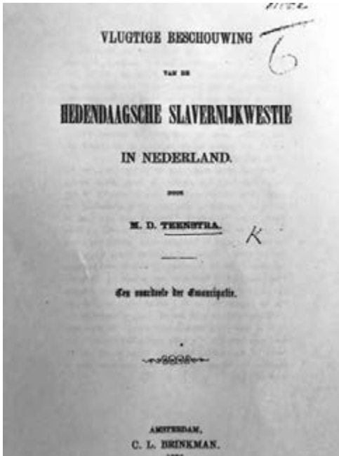
Titelpagina van Teenstra's Vluchtige Beschouwing (1856)

en bij alle vrije personen voor te staan ... Wij rigten dit ons geschrijf niet tot hem [=de slaaf], en wij stemmen het zijnen meester volkomen toe, dat het noodzakelijk is hem in duisternis te houden. En welk sterker bewijs kan er nu gevonden worden tegen de slavernij? Zij dwingt den eigenaar om stelselmatig den geest van den slaaf te verlagen; om strijd te voeren tegen het menschelijke verstand, en die volmaking tegen te werken, welke het einddoel is van den Schepper. "Wee hem, die den sleutel der kennis wegneemt!" Het ligchaam dooden is eene groote misdaad. De ziel kunnen wij niet dooden; maar wij kunnen haar in eenen doodslaap wikkelen. Dat doen alle slavenhouders, dat doen wij die de slavernij in onze Overzeesche Bezittingen blijven handhaven en laten voortduren. En zoude dit eene geringe misdaad zijn in het oog van haren Maker? 105