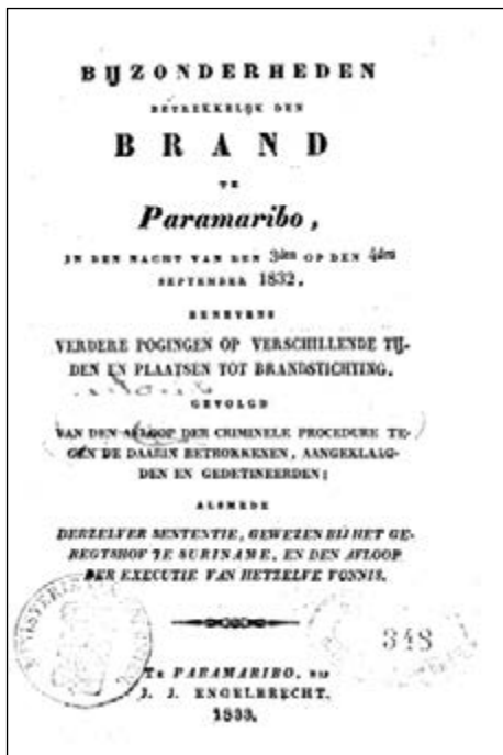
Teenstra's Bijzonderheden Betrekkelijk den Brand te Paramaribo (1833)