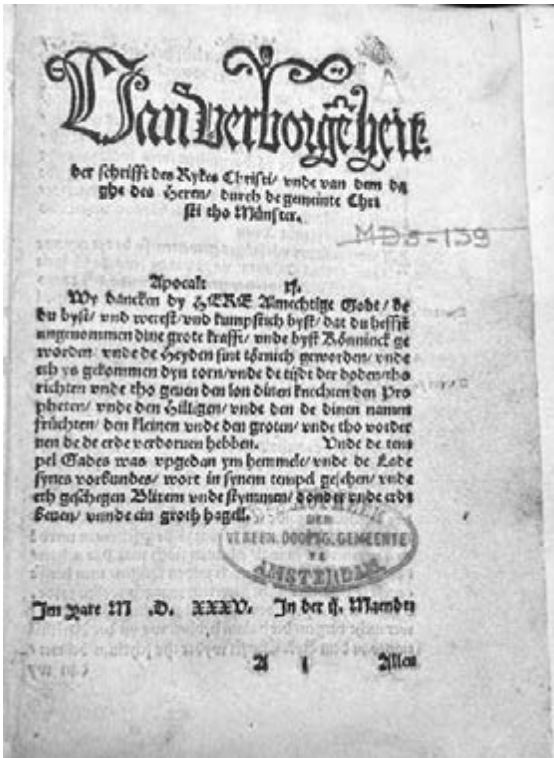
Rothmann, Van Verborgheit der schrift des Rykes Christi – DG bibl.: OTM: O 65-427

verhoopte toeloop van meestrijdende geloofsgenoten uitbleef. Van Geel zelf werd, door kogels doorzeefd, van de toren geworpen. De overlevenden van de tegenaanval zijn op gruwelijke wijze om het leven gebracht. 46