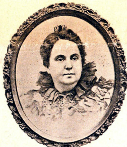
Mrs Katherine G. Thingley. Ledarinnan af "Universella Broderskapet".

O Du, som världar upprätthåller, Från hvilken allting utgår, Och till hvilken allt skall rända åter, Tag slöjan från Ditt anlete, den sanna solens, Som nu i gyllne ljus är doldt; På det vi sanningen må skåda Och våra plikter troget fylla, På pilgrimsfärden till Din helga boning.