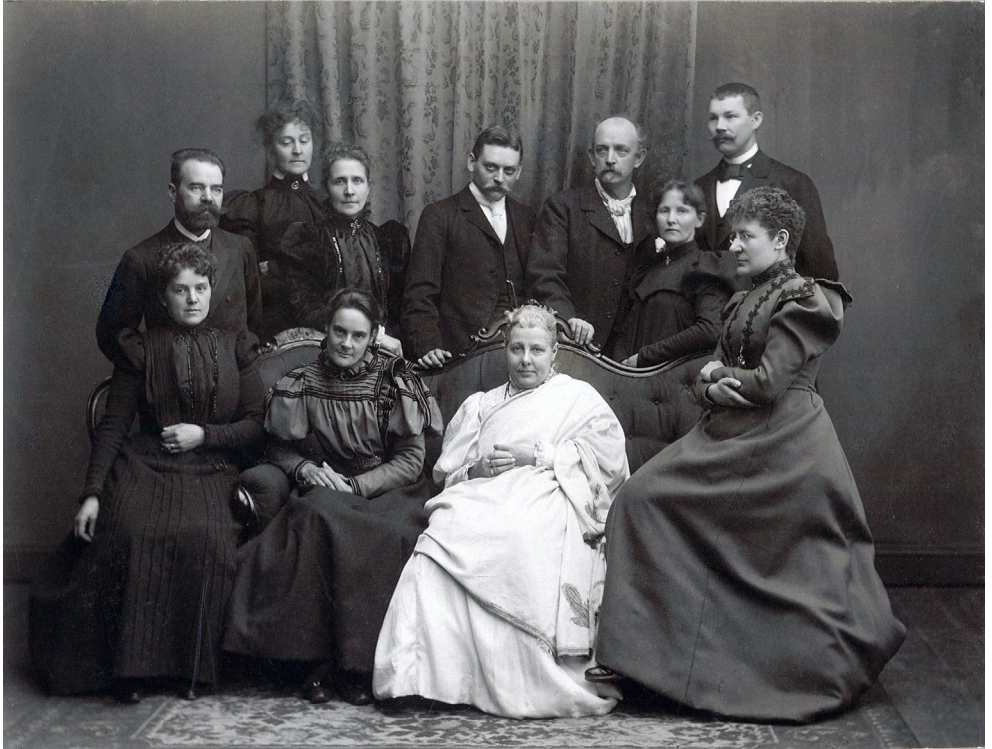
Annie Besant omgiven av teosofier från Göteborg och Malmö vid sitt besök i Lund 1898. Besant blev 1907 ledare för Teosofiska Samfundet (Adyar).

centrum i Point Loma i Kalifornien. 88 Teosofiska Samfundet (Adyar) hade fortsatt många medlemmar i Skandinavien. När sektionen höll årsmöte i Stockholm 1904 redovisades att antalet medlemmar uppgick till 648. De flesta av dessa bodde i Sverige, där det vid denna tid fanns 21 loger tillhörande Adyargrenen, från Lund i söder till Kiruna i norr. 89 Ledare för båda de konkurrerande teosofiska organisationerna besökte Sverige vid flera tillfällen. 90