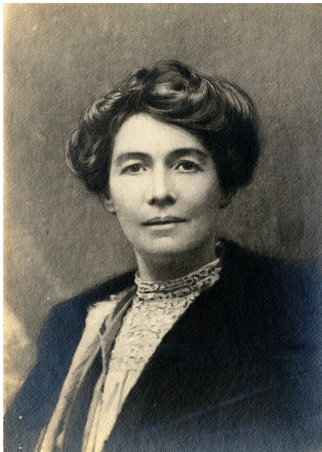
Socialisten, rösträttsaktivisten och teosofen Emmeline Pethick-Lawrence besökte Sverige 1922 tillsammans med sin make Frederick.