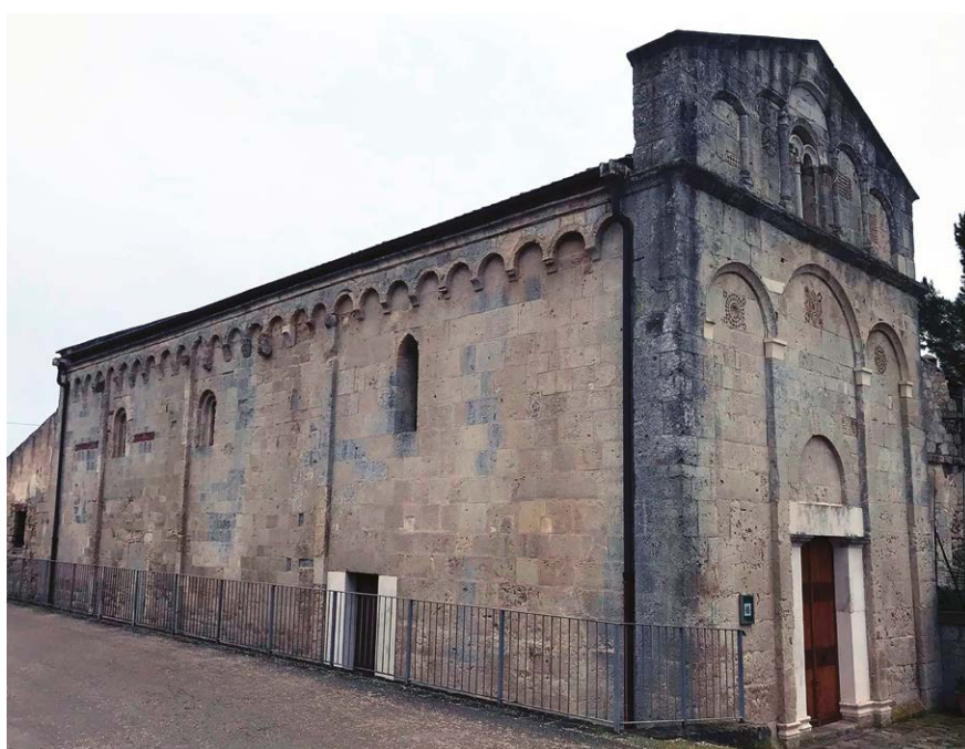
Figura 2 – Sassari, chiesa di San Michele di Plaiano, esterni.