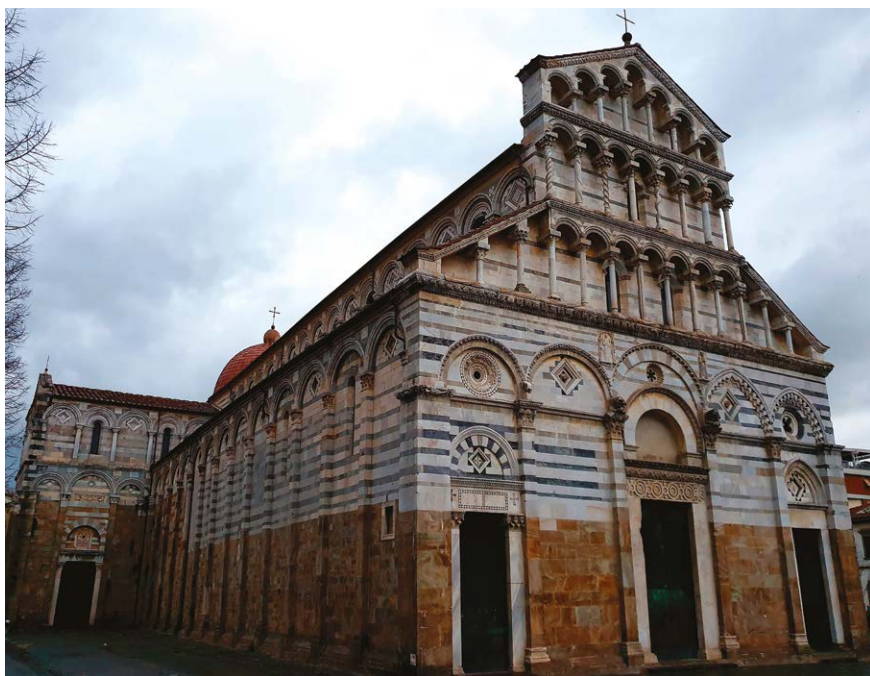
Figura 4 – Pisa, chiesa di San Paolo a Ripa d'Arno, esterni.