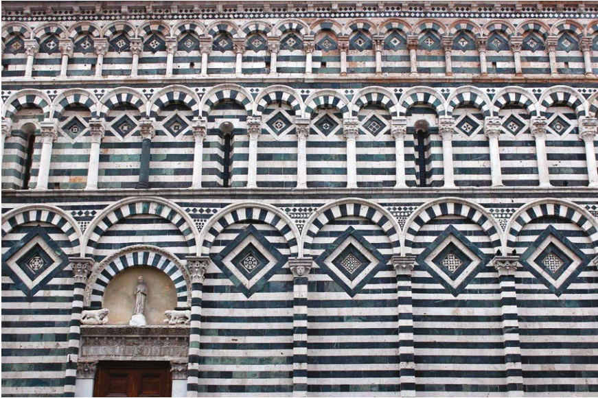
Figura 6 – Pistoia, chiesa di San Giovanni Fuorcivitas, particolare del fianco settentrionale.