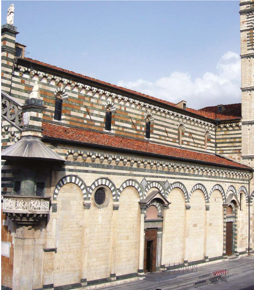
Figura 7 – Prato, cattedrale di Santo Stefano, prospetto meridionale.