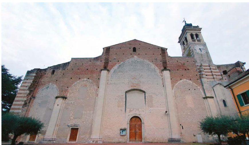
Figura 10 – Vago di Lavagno (Vr), chiesa di San Giacomo al Grigliano, esterno, prospetto occidentale.