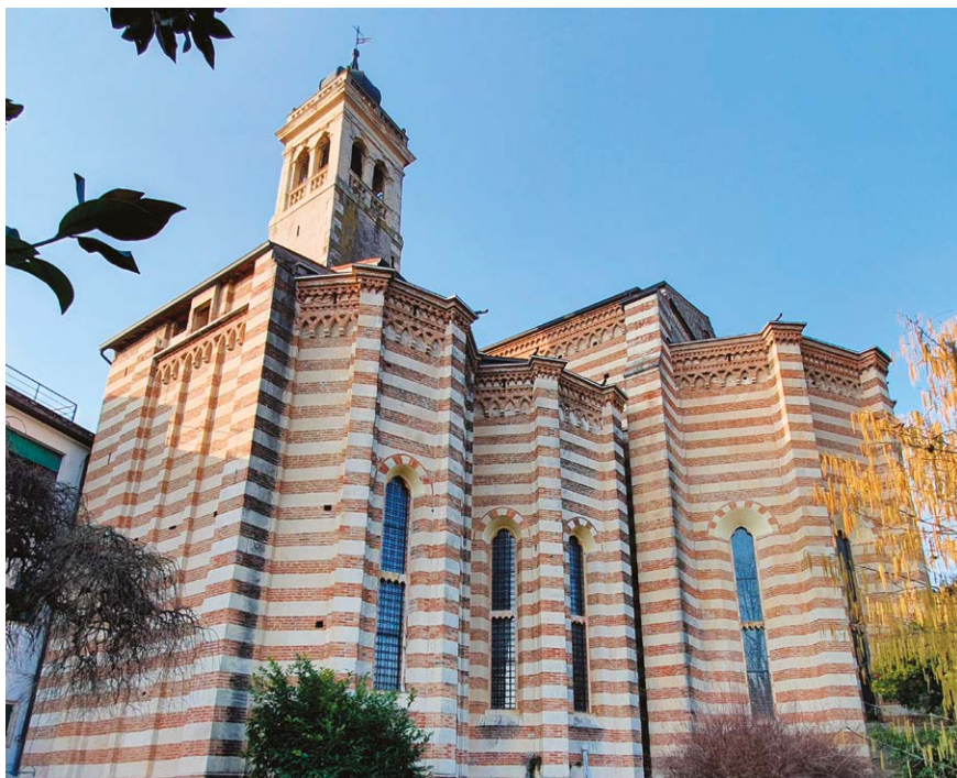
Figura 9 – Vago di Lavagno (Vr), chiesa di San Giacomo al Grigliano, esterno, testata absidale.