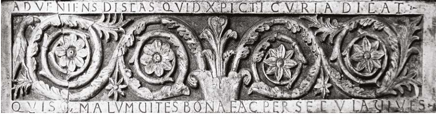
Figura 5 – Pistoia, cattedrale di San Zeno, facciata, architrave del portale meridionale.