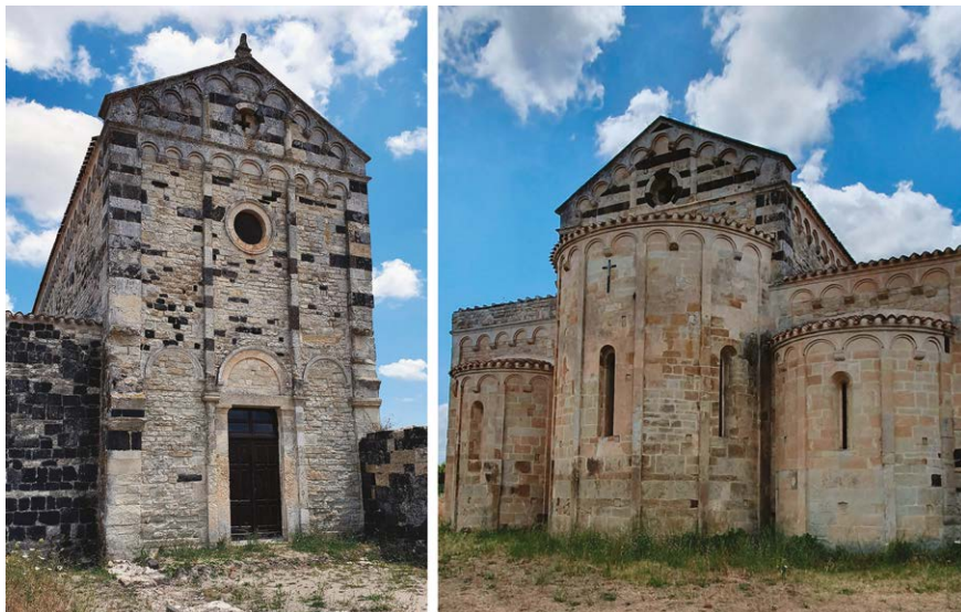
Figura 3 – Ploaghe (SS), chiesa di San Michele di Salvenero, facciata e absidi.