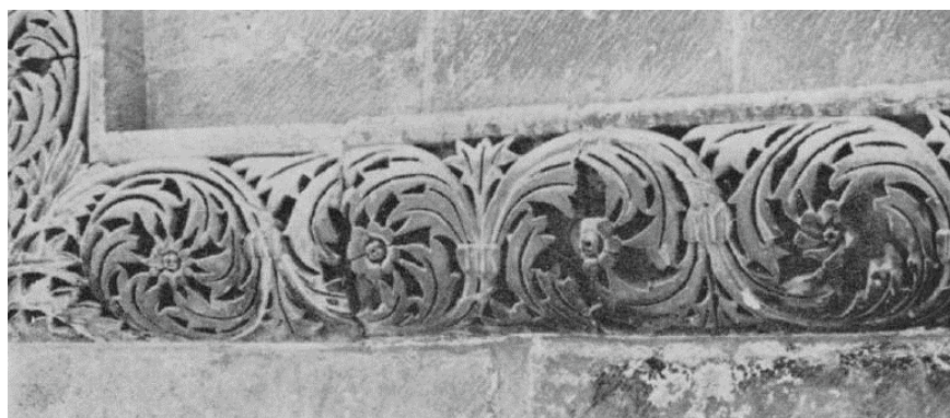
Figura 4 – Gerusalemme, fregio scolpito con una teoria di rosette, dettaglio della facciata sud della Basilica del Santo Sepolcro (da Kenaan 1973, tav. 59.B).