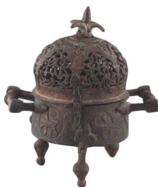
Figura 5 – Bruciaincenso in lega di rame fuso proveniente da Cordova, al-Andalus, X secolo. Cordova, Museo Arqueológico y Etnológico provincial, inv. D/92/6 (da MLS 1993, fig. 50).