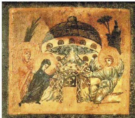
Figura 3 – Formella in alto a sinistra del riquadro rettangolare dipinto sul retro del coperchio di un reliquiario ligneo, Siria o Palestina, VI-VII secolo. Biblioteca Apostolica Vaticana, Museo Sacro Vaticano, inv. 1883A-B (da Fricke 2014, fig. 2, particolare).