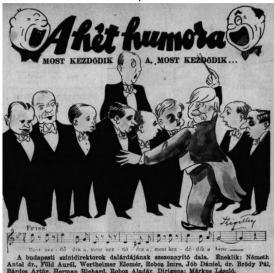
Szigethy István karikatúrája, Színházi Élet , 1938. 37. szám, 31.

A kép többféle értelmezésre ad lehetőséget. Ahhoz például, hogy a karikatúra vizuális humorát az olvasók értékelni tudják, ismerniük kellett az ábrázolt személyeket. Ez esetben tehát a Színházi Élet több tízezer előfizetőjének legalább egy része tudta, kik vezetik a pesti magánszínházakat, és ezek az igazgatók hogy néznek ki. Az pedig, hogy a rajzon (a zsidótörvény, és immár a Kamara-rendelet által is fenyegetett) üzletember-direktorok „egy kórusban